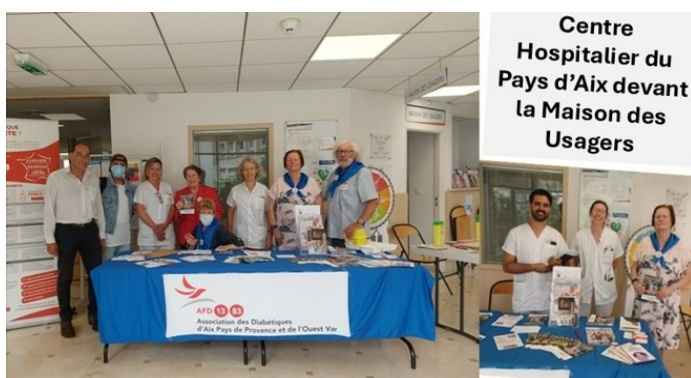
Centre Hospitalier du Pays d'Aix devant la Maison des Usagers

Notre actualité associative a été aussi riche que conforme à notre engagement au service de la santé de tous. Retrouvez ci-dessous en images les actions menées sur tout notre territoire. Un chaleureux merci à nos élus, à l'ensemble de nos partenaires, professionnels de santé, associations sportives ainsi qu'à tous les bénévoles !