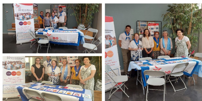
Hôpital du pays Salonais 12 juin 2025

Complétez votre information, consultez notre site