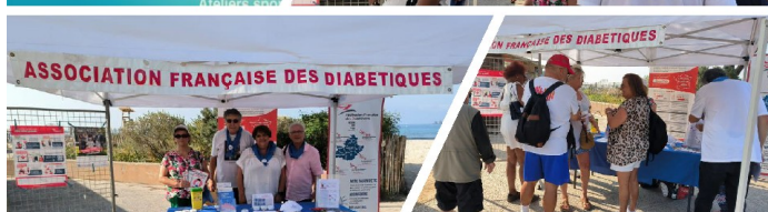
Parc Braudel- La Seyne Sur Mer 7 juin 2025